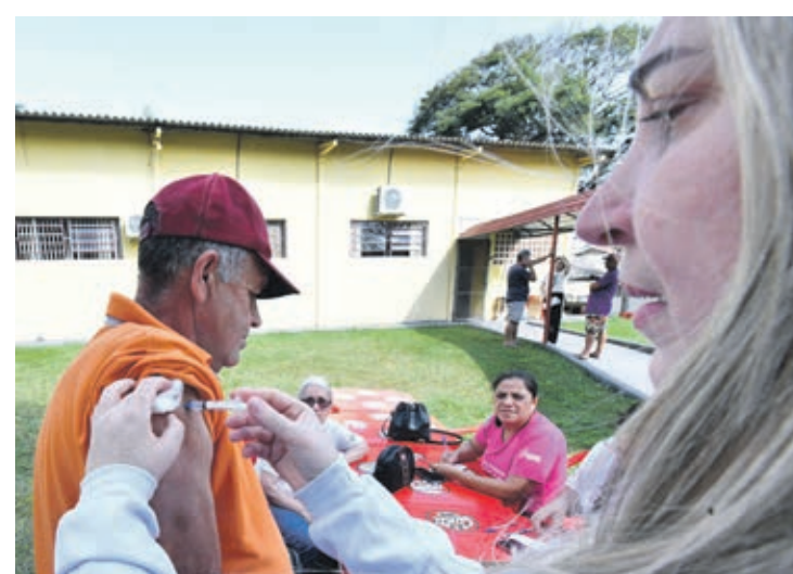
Moradores em situação de rua ganharam vacina e outros atendimentos

O encontro também teve a participação de profissionais da Secretaria Municipal de Assistência Social, que trabalharam o tema Política Nacional para a População em Situação de Rua, instituída pelo Decreto nº 7.053 de 23 de dezembro de 2009. "Registramos a união de força de todos contra o preconceito, a invisibilidade, a negação, o silêncio e o desamparo