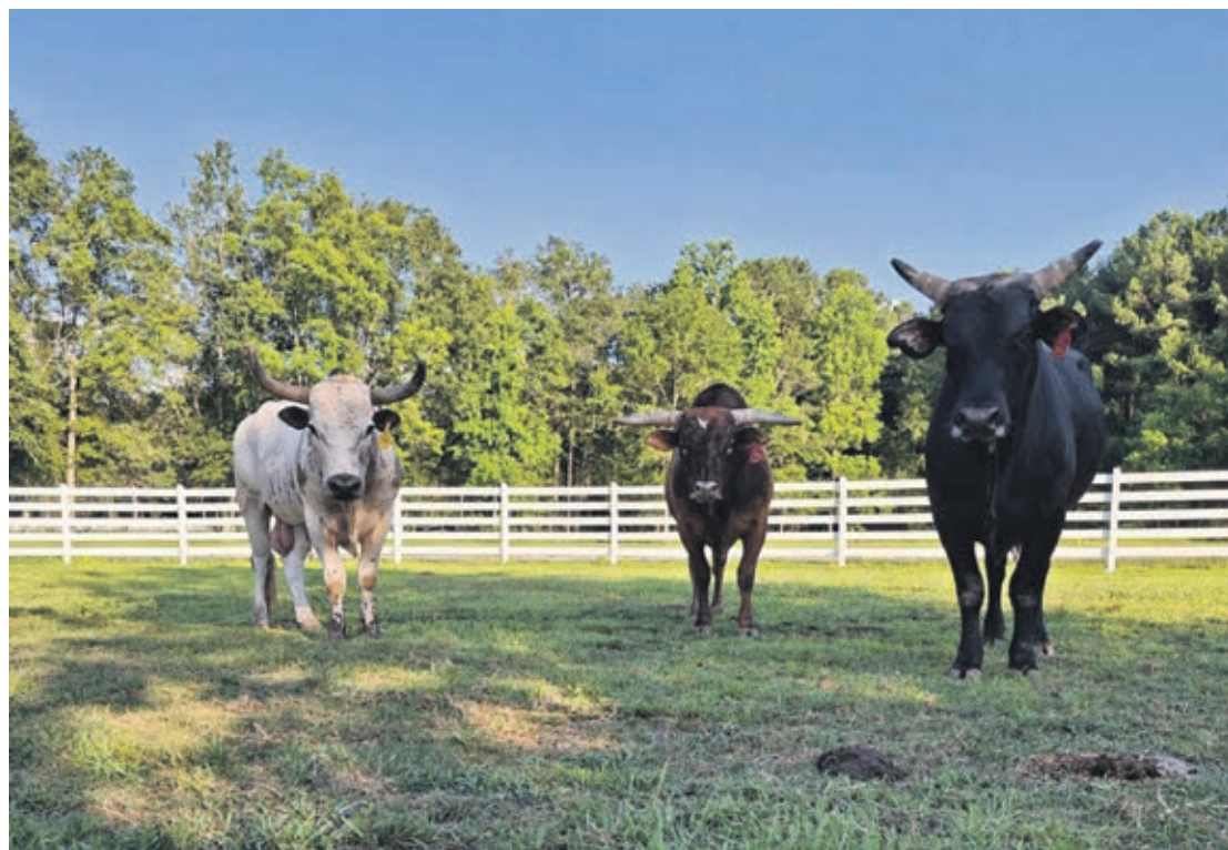
Um dos touros do ex-morador de Tapejara já se destacou entre 130 selecionados