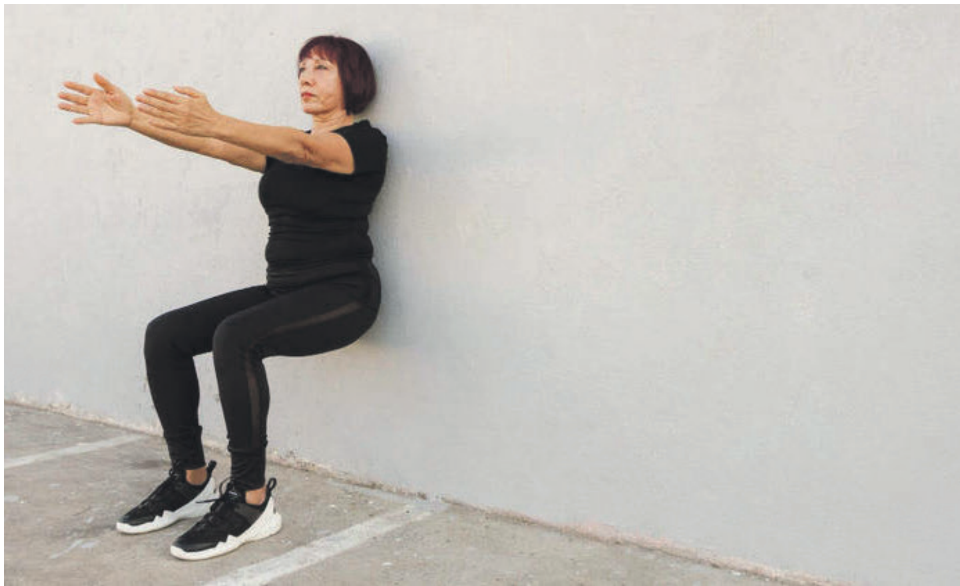
Estudo mostra que esse é um dos exercícios mais eficientes contra pressão alta

Por que exercícios isométricos mexem tanto com