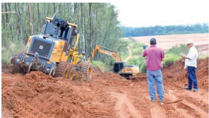
Secretário Mauro e morador acompanham as obras na estradas

“Como a nossa malha de estradas sem pavimentação é muito extensa, serviço não falta. Estamos priorizando os trechos mais complicados e os mais movimentados, por onde passa a nossa produção agropecuária em direção às rodovias, para acesso à cidade. Nossas equipes e equipamentos rodoviários, máquinas, tratores e caminhões, estão o tempo todo trabalhando para que os produtores tenham boas condições de tráfego nas estradas”, completou o prefeito Celso Pozzobom, que ao lado do secretário tem visitado rotineiramente as obras e serviços realizados pelo município.