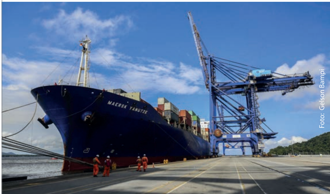
Mercado internacional oferece oportunidades, mas empresas precisam se preparar

liares interrompidos ou fragilizados e a inexistência de moradia convencional regular. "Eles utilizam os logradouros públicos como praças, calçadas e outras áreas para moradia e de sustento, de forma temporária ou permanente. O Centro Pop, assim como a Aproxim, são as unidades de acolhimento para pernoite temporário ou como moradia provisória utilizadas por eles em Umuarama", observa.