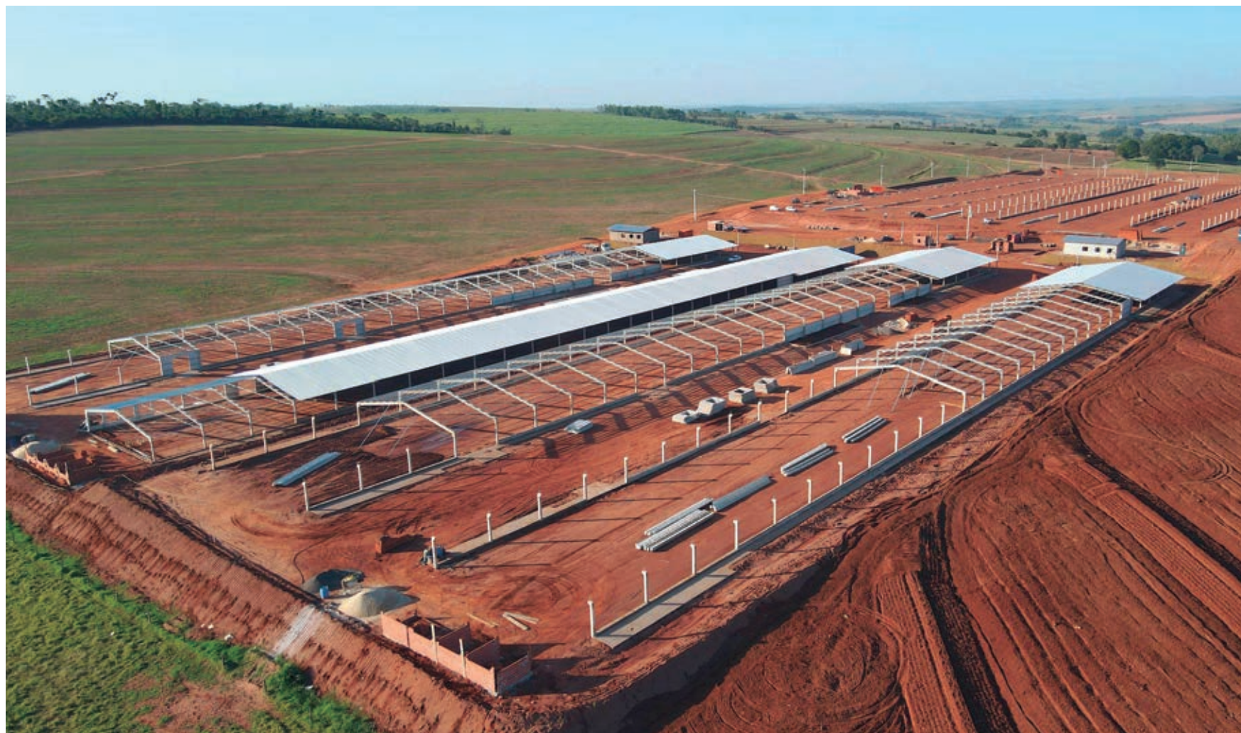
INVESTIMENTO MILIONÁRIO NA AVICULTURA EM UMUARAMA - O Programa de Incentivo à Implantação de Aviários da Prefeitura de Umuarama está participando de um grande investimento, que vai gerar muitos empregos e divisas para o município. Com 12 barracões de mais de 3 mil m 2 cada um, o aviário vai alojar cerca de 480 mil frangos, a cada ciclo de 60 dias, num investimento na casa dos R$ 20 milhões. Página A3