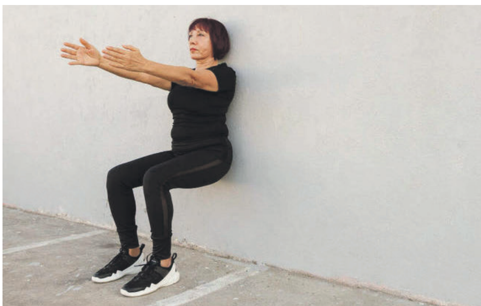
MELHOR EXERCÍCIO PARA REDUZIR A PRESSÃO ARTERIAL - O mais recente estudo sobre o controle da pressão arterial foi divulgado e diz que o exercício parado é o mais indicado e o campeão deles é a cadeirinha sem cadeira (foto). Página A7