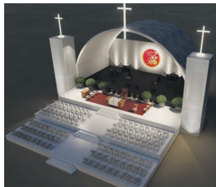
Simulação da estrutura que será montada para a celebração da festa jubilar no dia 17 de setembro