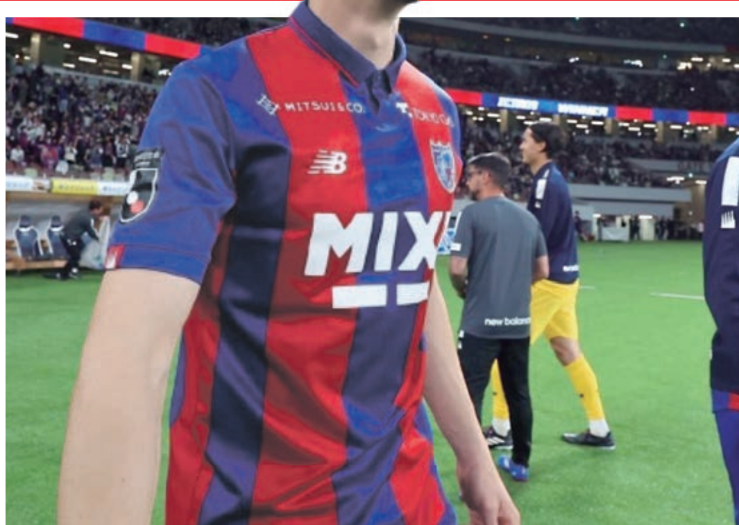
ATLETA DE UMUARAMA EM ALTA NO JAPÃO - O zagueiro Henrique Trevisan começou a carreira em Umuarama e, atualmente, é um dos destaques no Japão. Ele defende a equipe do FC Tóquio. E o time japonês atravessa uma boa fase com apoio do umuaramense. Página A8