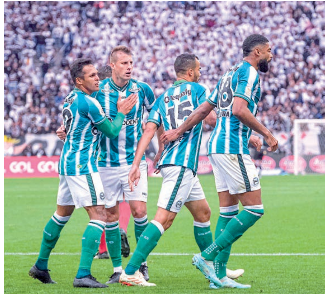
Por outro lado, o Coritiba quer vencer para sonhar em sair da zona de rebaixamento