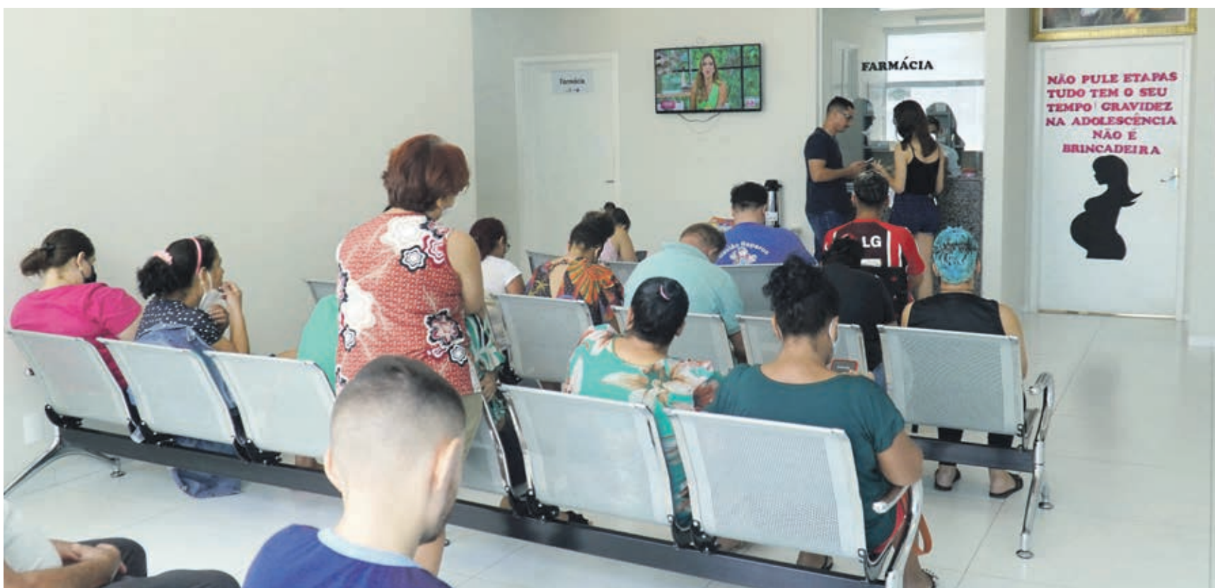
Todos os dias o ambulatório onde se faz os testes para saber se a pessoa está contaminada pela dengue fica lotado de pacientes