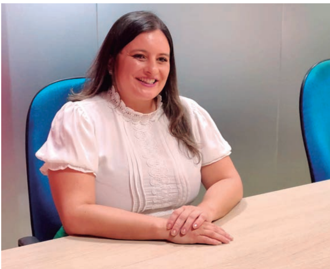
Vereadora diz que é pré-candidata a prefeita de Umuarama e não a vice

Quanto a quem deve ser seu vice, disse que ainda está a procura e completa que a casa já está arrumada, com ao menos dois partidos ao seu lado e com chapas completas para vereador. Mas por questão de estratégia política e evitar ter aliados ‘roubados’, prefere guardar segredo. Até o momento