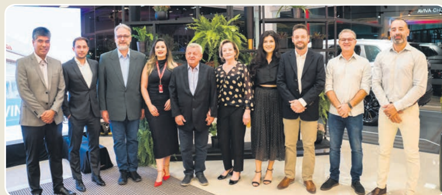
Diretores e parceiros da Enjin durante o evento de reinauguração em Umuarama