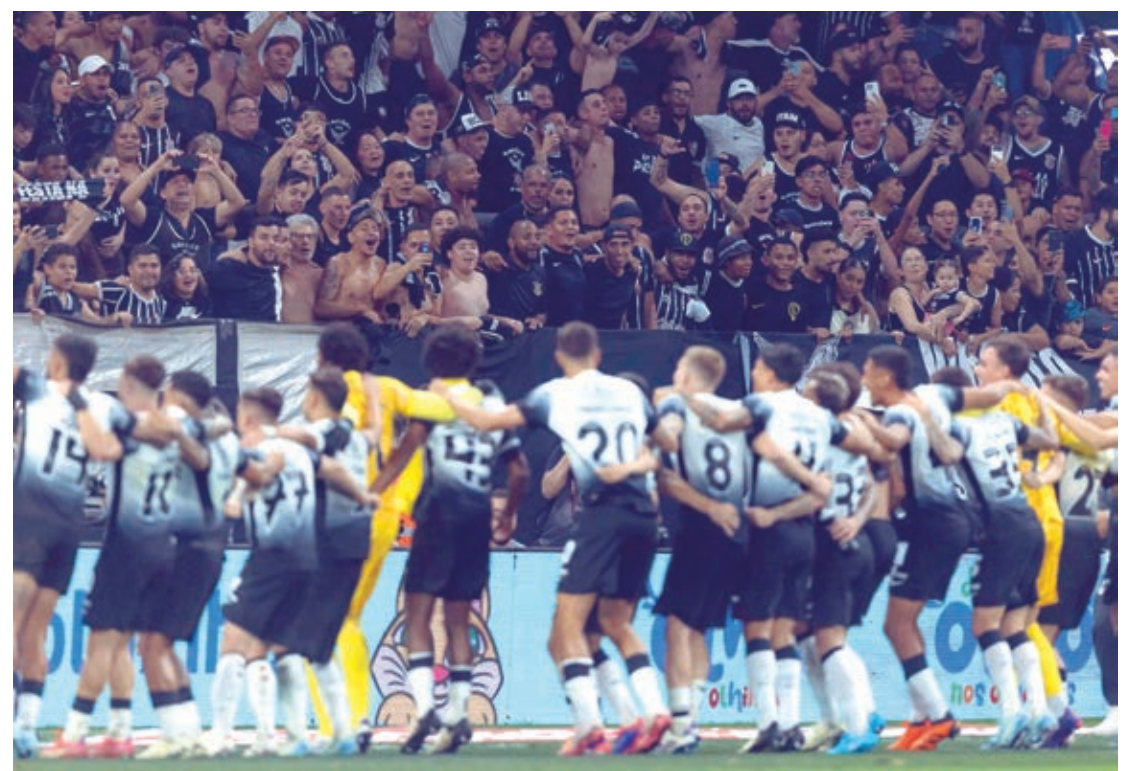
Ainda comemorando a classificação na Copa do BR, Timão joga hoje no Rio

O Corinthians terá a dura missão de bater um Botafogo que só foi derrotado quatro vezes em casa nesta temporada, duas delas no Brasileirão - para Cruzeiro e Bahia. Não é à toa que, muitas vezes apontado como dono do